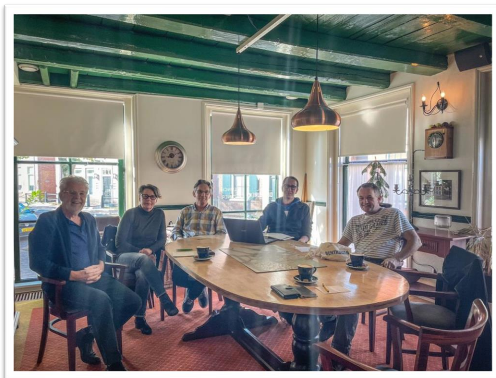
De oprichters van het genootschap.

Stichting Historisch Genootschap Het Rijndorp is opgericht op 21 december 2021. Dit verslag is het eerste jaarverslag van het genootschap. Hoewel Het Rijndorp nog een klein gezelschap is kunnen we terugkijken op een actief en geslaagd jaar. Bij diverse activiteiten in het Rijndorp hebben we kennis gemaakt met het publiek, we hebben onze collectie kunnen aanvullen en we voelen ons ondersteund door een groeiend aantal donateurs.