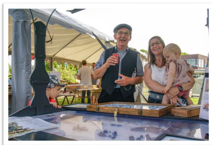
De Zanderijvondsten tentoongesteld bij Molen de Gerechtigheid

Het registreren en determineren van de vondsten is een tijdrovende klus en zal in 2023 worden voortgezet. Inmiddels zijn er contacten gelegd met archeoloog Menno Dijkstra en andere geïnteresseerden die ons eventueel kunnen helpen met determineren. Ook zal er in 2023 gewerkt worden aan een bescheiden tentoonstelling waarin we 'het verhaal van de Zanderij' willen vertellen aan de hand van de detectorvondsten. Voor deze tentoonstelling is budget beschikbaar vanuit de eerste aankoop.